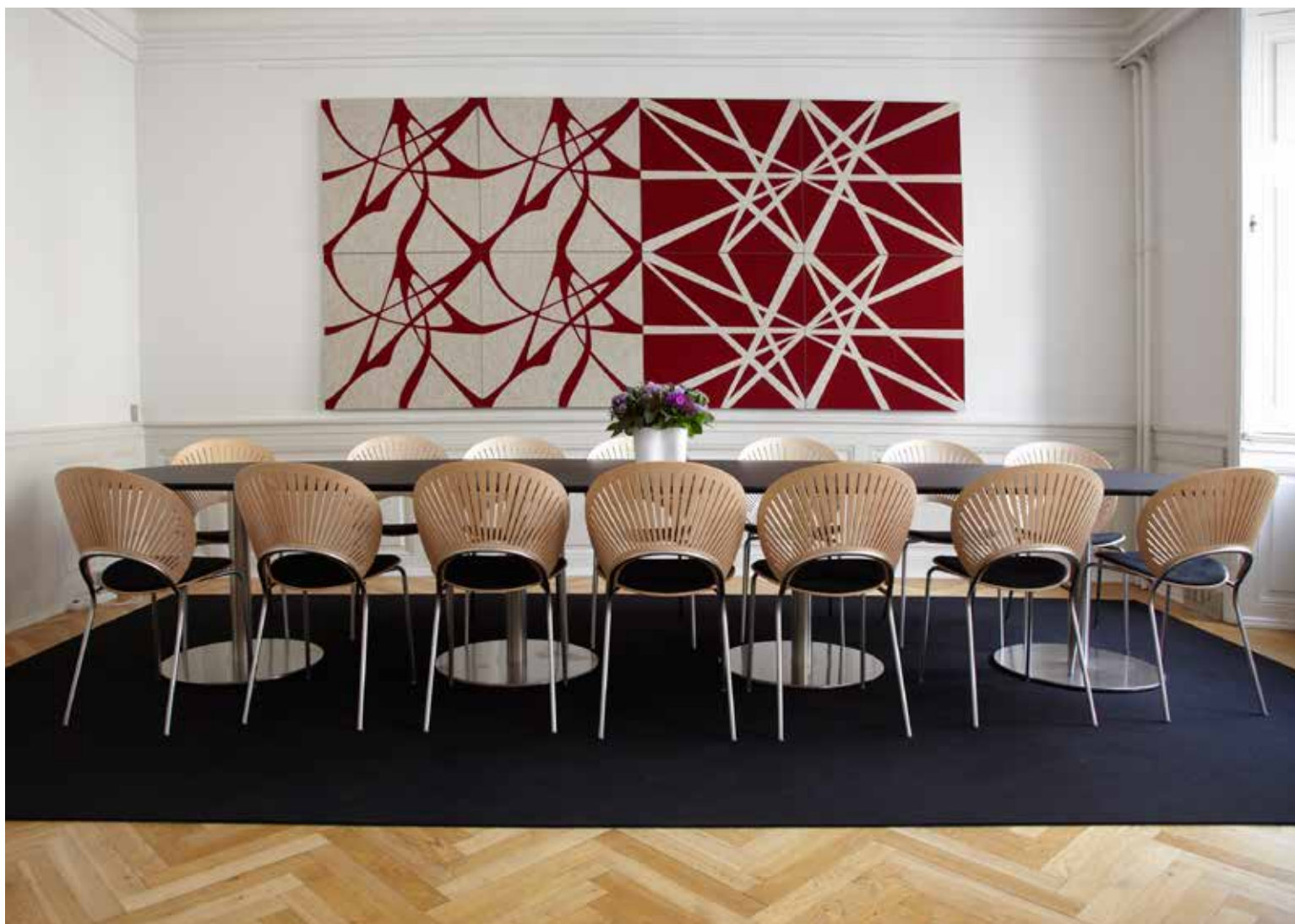
Indretning ved Rektorföreningen, Kbh. Twister i to mønstre på væggen. Filttæppe på gulvet. Filtsæder på stolene.