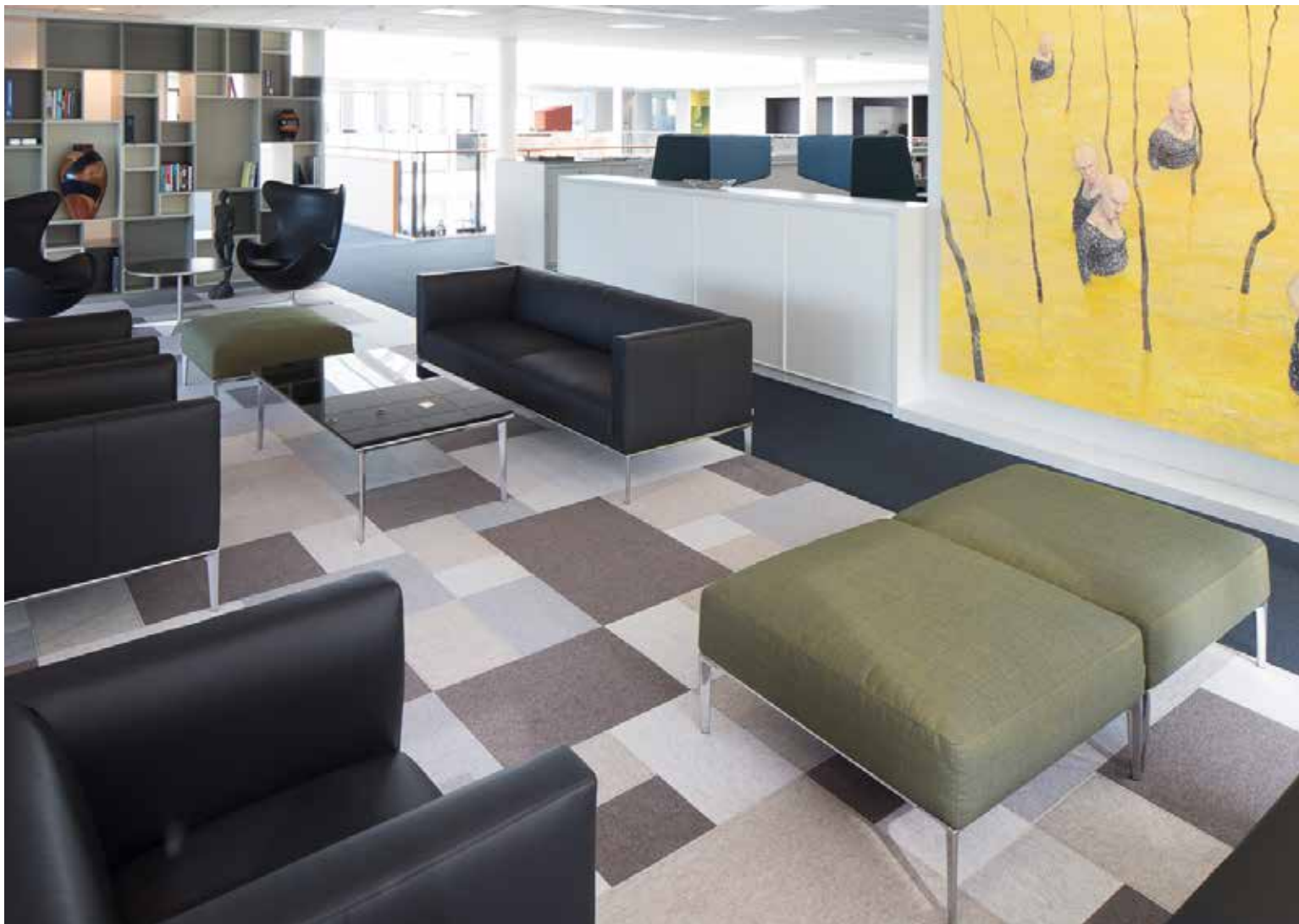
Afloor tæppe hos ISS, Søborg