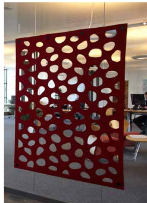
GlassCover i Fåborg sparekasse.

– Vil man eksempelvis have sit firmalogo på, så laver vi det. Med den såkaldte GlassCover filt kan man tilmed trække lys ind udefra og samtidig bevare den eftertragtede ro.